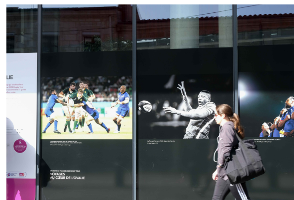
La estación de Bordeaux Saint-Jean