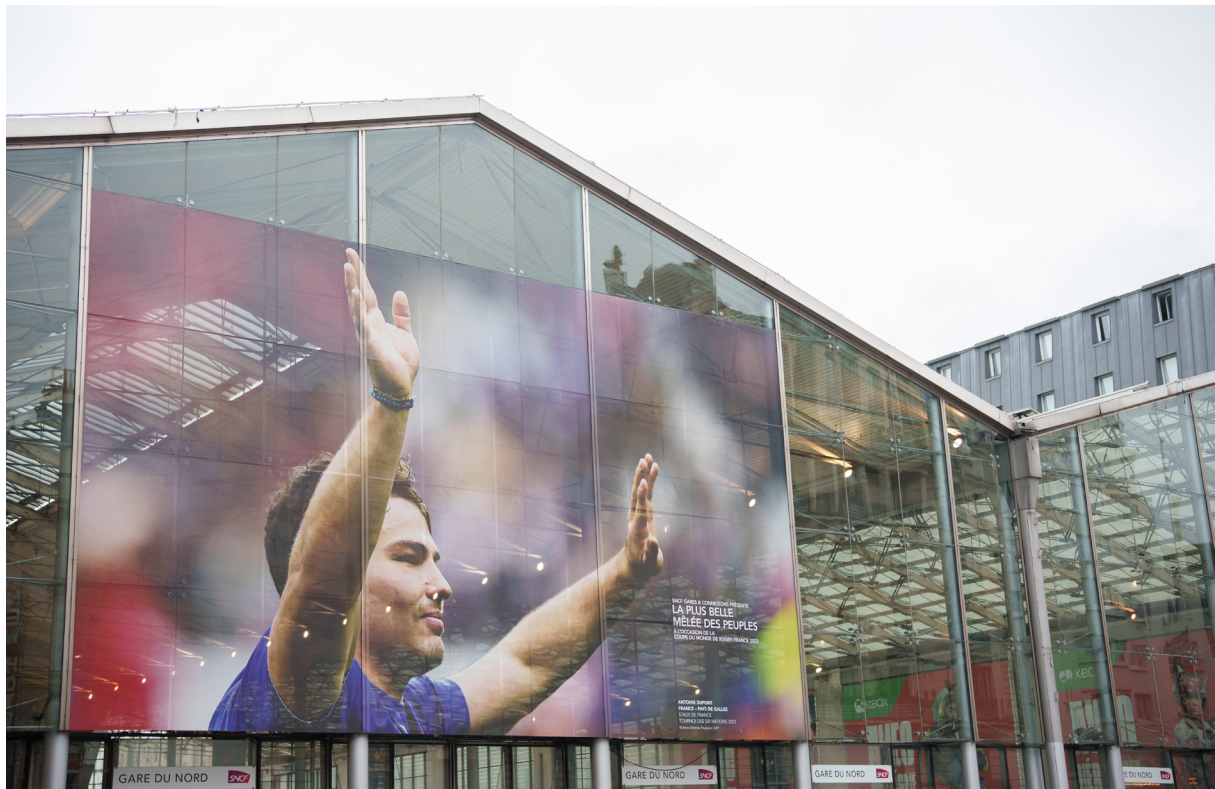
La estación del Norte de París