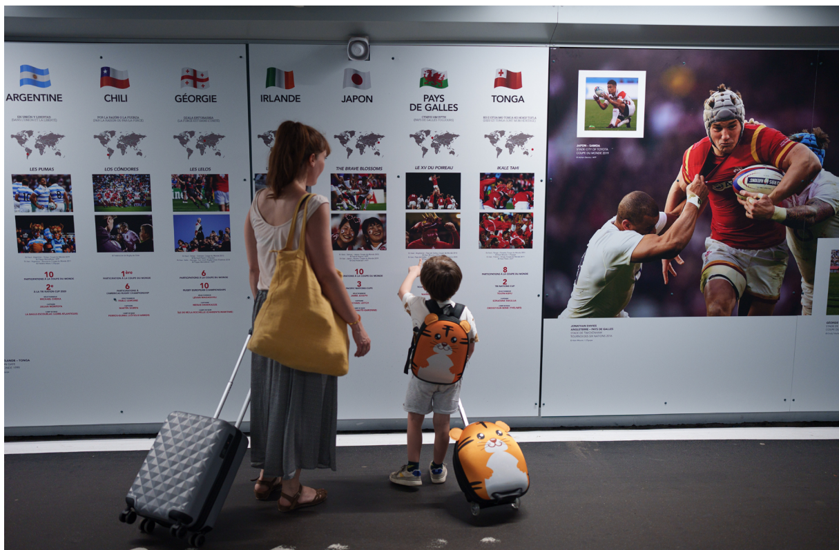
La estación de Nantes

Además de estas exposiciones, en las estaciones francesas se organizarán actividades durante toda la competición, como photocalls, talleres de maquillaje, videomapping y muros de expresión. Visite el sitio web Avant Match para más información.